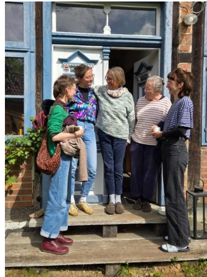
Einige Studentinnen waren unsere ersten Gäste zur KLP.